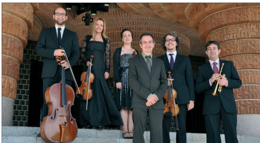
El Ensemble Marboré tuvo una gran acogida entre el público.