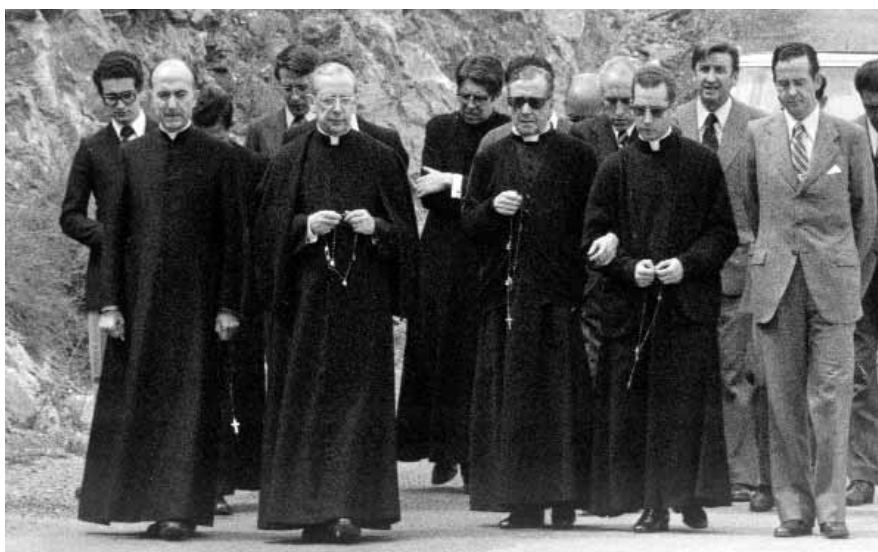
Romería penitente desde el crucero a la ermita. En primer plano, el fundador del Opus Dei, flanqueado por monseñor Álvaro del Portillo y don Javier Echevarría. Abril de 1970.