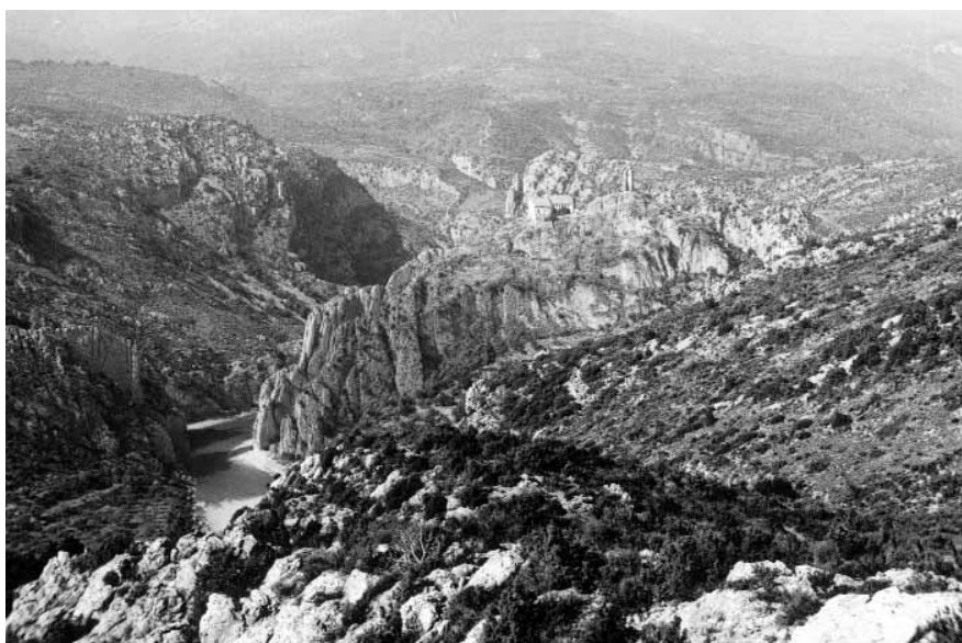
Río Cinca a la altura de Torreciudad. Década de 1960.