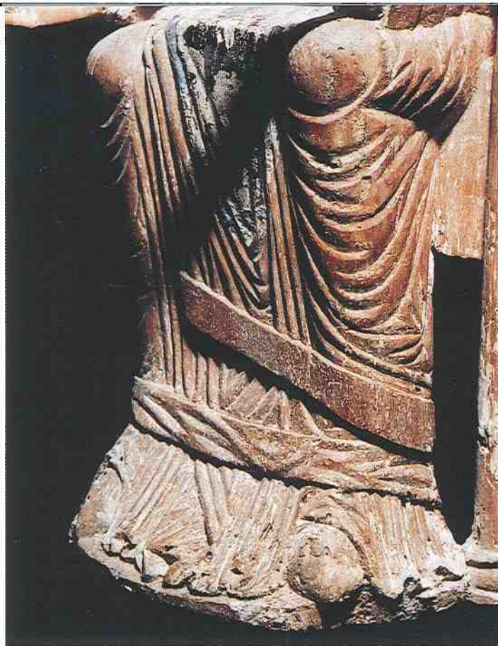
Detalle de la talla, con el trozo de policromía que se respetó.

En la escultura de la Virgen de Torreciudad se observan una serie de detalles que, desde el punto de vista estilístico, denotan una concepción muy arcaica de ejecución. Efectivamente el hieratismo y frontalidad de las figuras, la buscada desproporción de las cabezas y manos, el tratado del ropaje en relieve muy plano, la estructura del plegado de la túnica, etcétera, responden a los principios metódicos del románico, inflexible en su esencia estructural. Los maestros de esta época no buscan la reproducción realista y proporcionada de los cuerpos, sino su interpretación abstracta con arreglo a una fórmula expresionista . El origen de las tendencias estilísticas de esta forma de concebir la obra de arte hay que buscarlo en el presunto arte lombardo, que no es